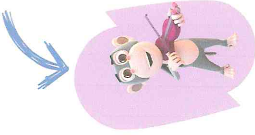
KARAKTER : YUMİ