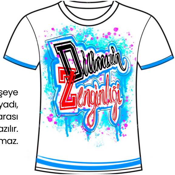
Ek: Örnek Tasarım

Arka Sol Üst Köşeye Öğrencinin Adı-Soyadı, T.C Kimlik numarası Okulunun bilgileri yazılır. Eserin ön yüzüne herhangi bir bilgi yazılamaz.